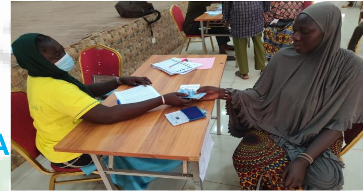
Tableau 4 : situation de la distribution du cash